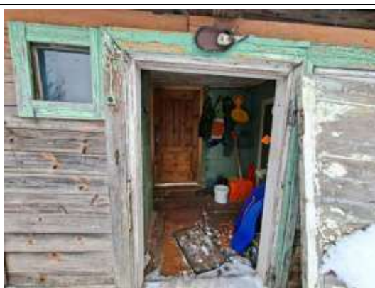
Ieeja dzīvojamā mājā