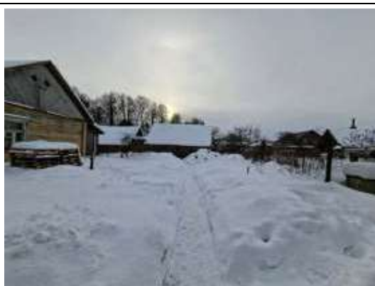
Teritorija un palīgēkas