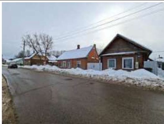
Būve (dzīvojamā māja)