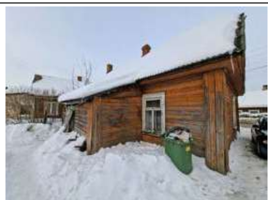
Būve (dzīvojamā māja)