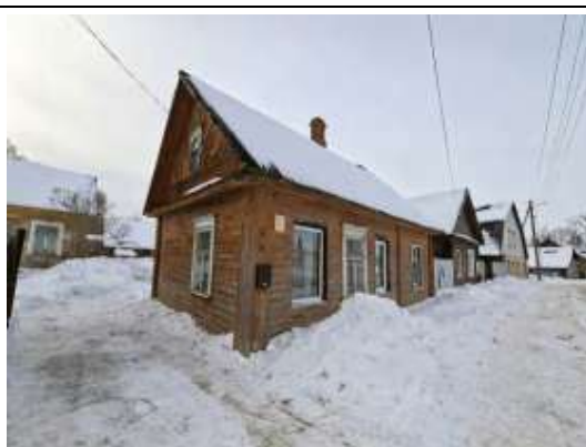
Būve (dzīvojamā māja)