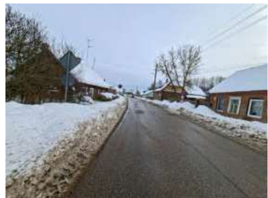
Piebraucamais ceļš pie objekta