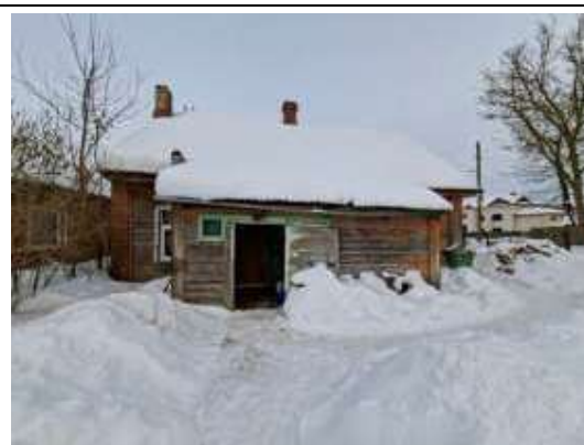
Būve (dzīvojamā māja)