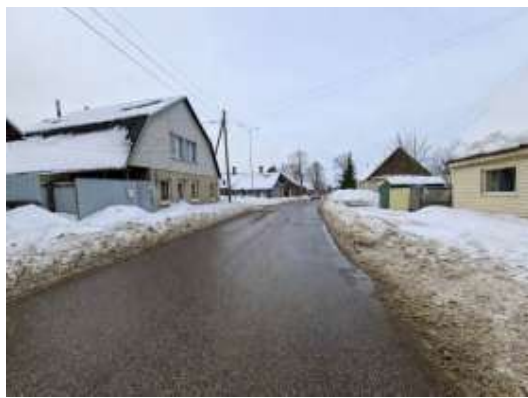
Piebraucamais ceļš pie objekta