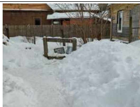
Teritorija un aka