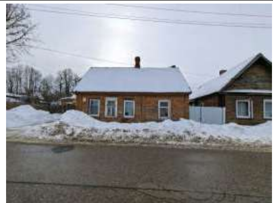
Būve (dzīvojamā māja)